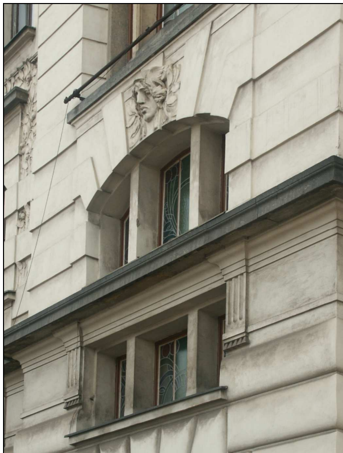
celkový pohled z exteriéru