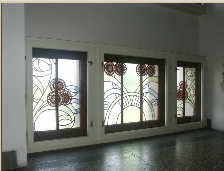
celkový pohled z interiéru

repasovat, ponechat na původním místě, zachovat klíčky, závěsy, restaurovat vitráž, obnovit původní barevnost oken, bude-li zjištěna, nebo provést nátěr dle stávajícího stavu, s výjimkou klíček natřít i kování – viz stávající stav Obnovit původní barevnost podle průzkumu barevnosti oken. Z interiéru obnovit bílý nátěr, z exteriéru obnovit povrchovou úpravu, shodnou jako u již rekonstruované části C. Viz technologický postup TP/117 (fládr). Po dokončení opravy rámu nechat restaurátorem zkontrolovat vitráž.