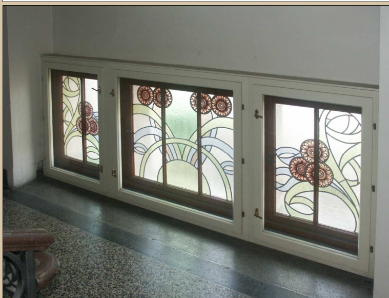
celkový pohled z interiéru